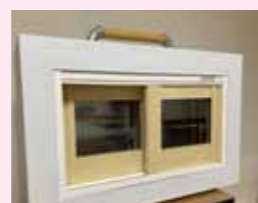
防音体感BOX 動画 (全36秒)